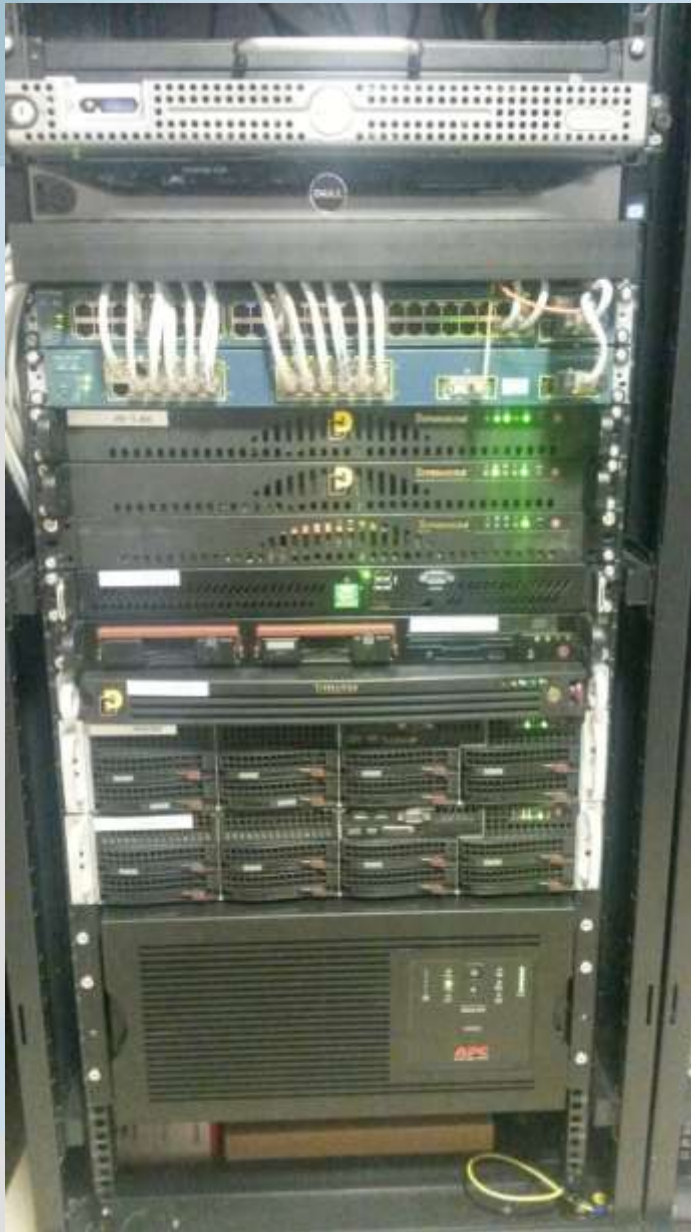
ISOC AM GA, Yerevan